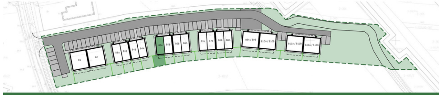
RZUT PARTERU |